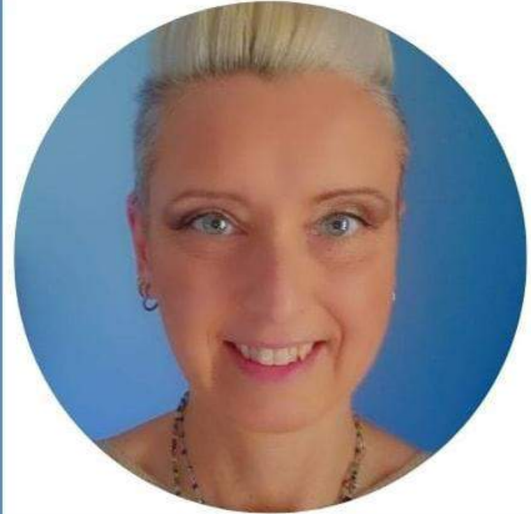
MARTA ERODIANI SCUOLA PRIMARIA

Sono fermamente convinta che la scuola sia un luogo di crescita fondamentale per gli studenti e che il benessere di tutti i componenti della comunità scolastica sia un prerequisito per il successo formativo. Per questo, se eletta al CSPI, mi impegnerò con tenacia e passione a rappresentare gli interessi di tutti, lavorando per un sistema scolastico sempre più inclusivo, equo ed efficiente."