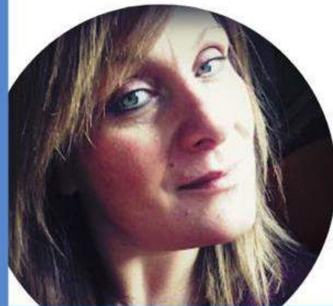
NADIA TAVELLA SCUOLA SECONDARIA DI PRIMO GRADO

Il nostro scopo come lista sarà quello di portare una fotografia attendibile della realtà, e rappresentare al meglio tutto il comparto scuola. Bisogna ridare dignità alla figura docente perché siamo i primi agenti di inclusione sociale ed educativa.