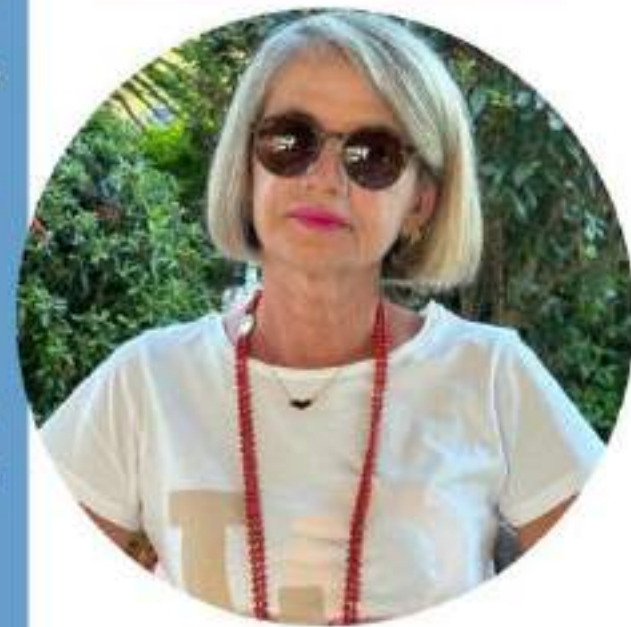
Michela Acconci Scuola Primaria

Ecco il perché della mia candidatura e la scelta di questo Sindacato che ha fatto proprie le lotte per una SCUOLA DEMOCRATICA, LIBERA che sappia dare dignità' alla professione degli insegnanti e che passi anche da una " giusta" riqualificazione economica.