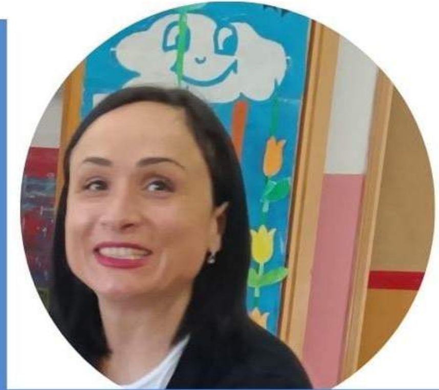
CAROLINA PARISI SCUOLA DELL' INFANZIA

Per me insegnare non è solo un lavoro, ma una vera e propria passione. Ho scelto questa professione con consapevolezza, lasciando alle spalle un posto fisso in un'altra pubblica amministrazione. Il desiderio di trasmettere conoscenze e di fare la differenza nella vita dei ragazzi ha prevalso sulla stabilità economica. Conosco bene le sfide e le difficoltà che ogni giorno affrontiamo nelle scuole. Per questo motivo, ho deciso di candidarmi al CSPI: voglio essere la vostra voce nelle istituzioni e portare avanti le vostre esigenze e preoccupazioni. Voglio rappresentare al meglio la nostra categoria e contribuire a costruire un futuro migliore per la scuola italiana.