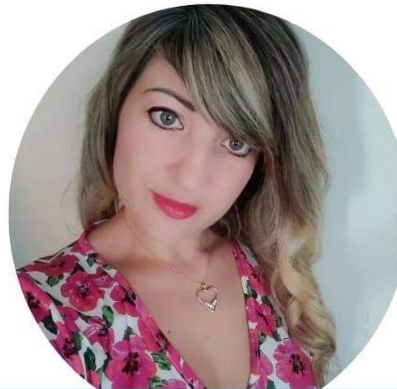
Vanessa Acri Scuola Primaria

Voglio una scuola ove integrazione e inclusione non siano solo belle parole sulla carta ma qualcosa di reale e concreto. Voglio che i docenti si sentano motivati nel loro lavoro perché adeguatamente riconosciuto nella sua dignità e adeguatamente remunerato. Voglio docenti con la voglia di portare i bambini in gita perché lo Stato gli riconosce la trasferta e li tutela giuridicamente. Voglio una scuola che abbia ambienti idonei all'apprendimento e con i giusti strumenti e non tanti fondi investiti male a causa dei troppi vincoli imposti. Insieme possiamo! Scegli NoiScuola Bene Comune.