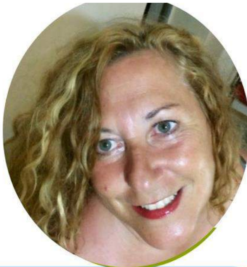
EMILIA MEZZATESTA SCUOLA PRIMARIA

Ho accettato di candidarmi in questa lista perché credo nelle cose umili, ho sempre lottato per il riscatto sociale e la dignità della persona, promuovendone la crescita personale e sociale. Conosco il mondo della scuola paritaria, della scuola pubblica e della cooperazione sociale. Ogni giorno della mia vita dal 1990 l'ho vissuto educando, empatizzando con alunni, colleghi, famiglie, associazioni. Ritengo che la nostra presenza nel mondo del sindacato dei "Grandi" possa fare la differenza. Se sei sfiduciato/a e non ti senti ascoltato/a sappi che tanti docenti sono nella tua stessa condizione. Fai un passo di fiducia, aiutaci a riappropriarci della dignità del ruolo, ormai perso nel tempo.