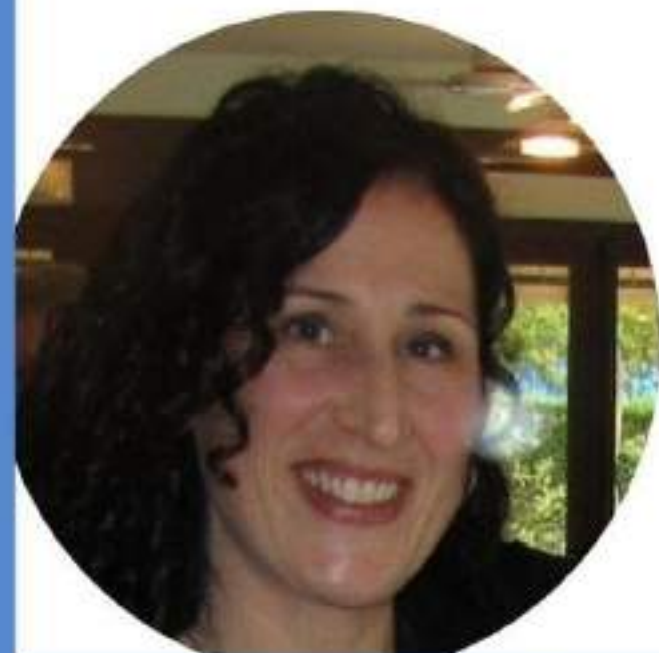
GIOVANNA TESTA SCUOLA PRIMARIA

Credo che il CSPI possa essere uno strumento per dare voce ai docenti e per costruire una scuola migliore per tutti. Se anche tu credi in questi valori vota per me, vota la lista "NOI SCUOLA BENE COMUNE"!